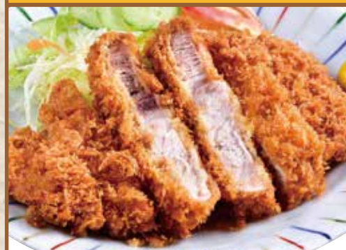
■ とんかつ 580円