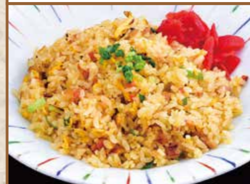
■ 五目チャーハン 540円