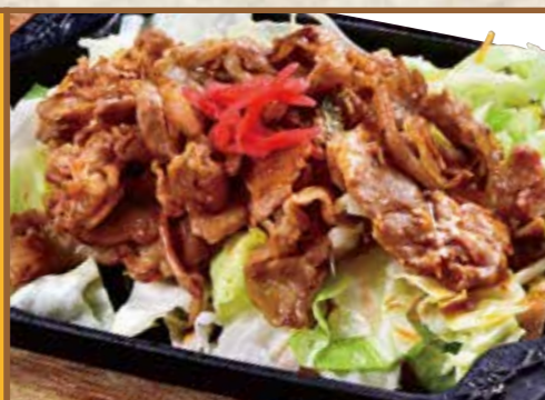
■ しょうが焼 580円