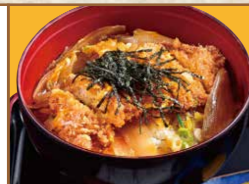
■ カツ丼 780円