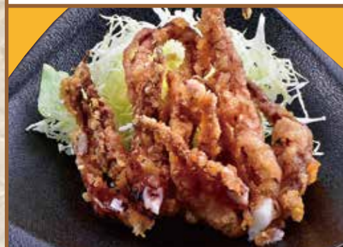
■ げその唐揚げ 450円