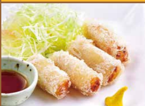
■ 春巻き 320円