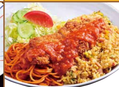
■ トルコライス 880円