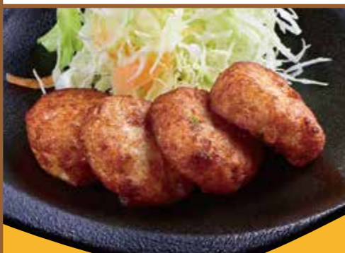
■ さつま揚げ 320円