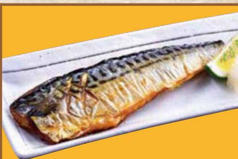
■ 焼魚 (サバ/サンマ) 420円