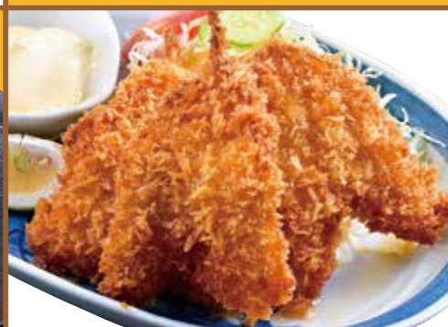
■ キスフライ 580円