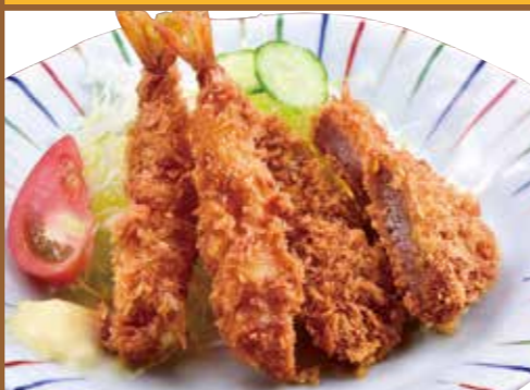
■ えびとヒレカツ 580円