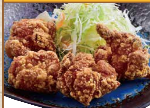
■ 鶏の唐揚げ 450円