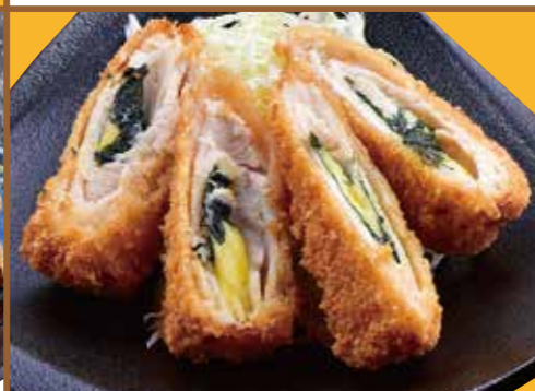
■ 大葉のチーズ巻き 480円