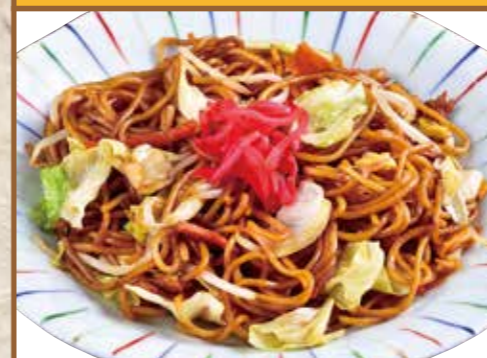
■ 焼そば 500円