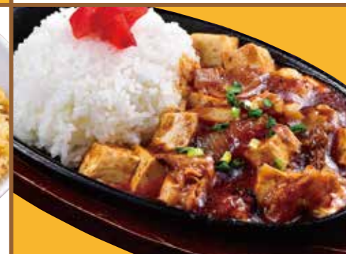
■ マーボー丼 540円