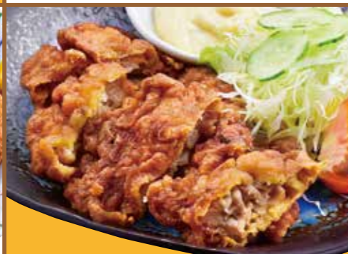
■ チキン南蛮 580円